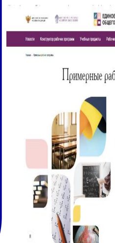
Структура примерной рабочей программы

3. Российский футбольный союз https://rfs.ru/projects/russian-football/futbolvshkole/dokumenty-3